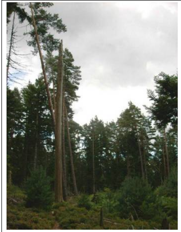
...zum Baldenhofer Graben - ein alter Wassergraben aus dem Mittelalter