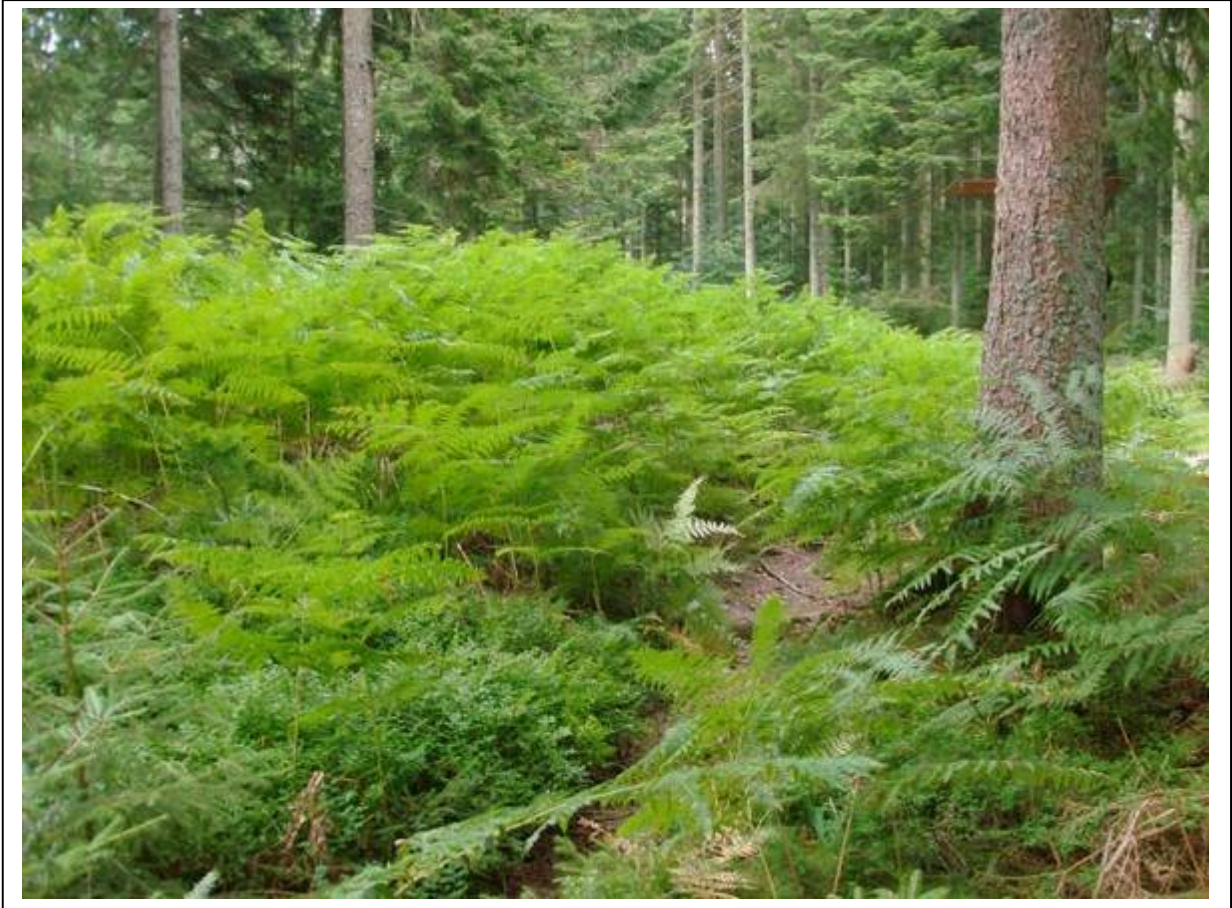
...über Wurzeln, Gestrüpp und Farn...